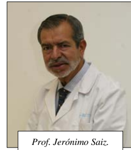
Prof. Jerónimo Saiz.

El programa de este año incluía novedades respecto a los anteriores en cuanto a la estructura formal. Tal y como explica el Prof. Jerónimo Saiz, presidente de la SEP, “además de conferencias, simposios, mesas redondas, cursos y talleres, se han incluido tres Foros de Debate sobre Formación en Psiquiatría, Identidad de la Psiquiatría y Organización de la Asistencia Psiquiátrica; también se han reducido los simposios oficiales en beneficio de un mayor número de talleres, una actividad más interactiva y que permite una mayor participación de los asistentes. En conjunto, nuestro Congreso va dar cada vez más importancia a la formación continuada”.