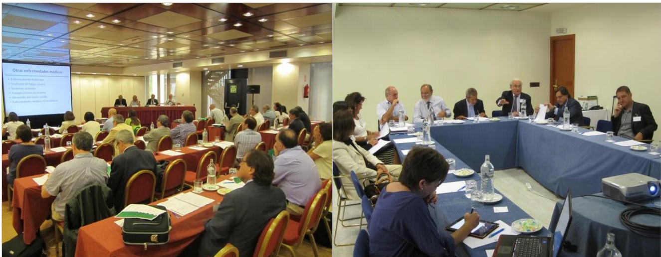
Dos momentos de la reunión del grupo de trabajo para el Consenso Depresión y Salud Física.

Consenso Depresión y Salud Física. El grupo de trabajo que está desarrollando el Consenso Depresión y Salud Física se reunió el pasado 14 de septiembre en Madrid con expertos en la materia para dar los últimos pasos para elaborar unas recomendaciones finales sobre la salud física del paciente con depresión. El encuentro se desarrolló en dos partes. En la primera, el grupo de trabajo y los expertos discutieron las diversas propuestas de recomendaciones para alcanzar un primer acuerdo de posibles recomendaciones; mientras que en la segunda el Comité Científico y el Comité Asesor trataron de sintetizar todas las propuestas en un decálogo.