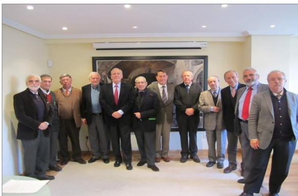
Miembros del Colegio de Eméritos durante la reunión en la sede de la FEPSM.

Con este Código de Buenas Prácticas, la SEP pretende proporcionar a sus asociados un instrumento que presida su actuación y establezca las conductas a seguir, a la vez que difunda los valores de la entidad y divulgue los contenidos del Código más allá de su ámbito de aplicación, a fin de facilitar a la sociedad civil una mejor información sobre la aplicación de las buenas prácticas realizadas por la sociedad.