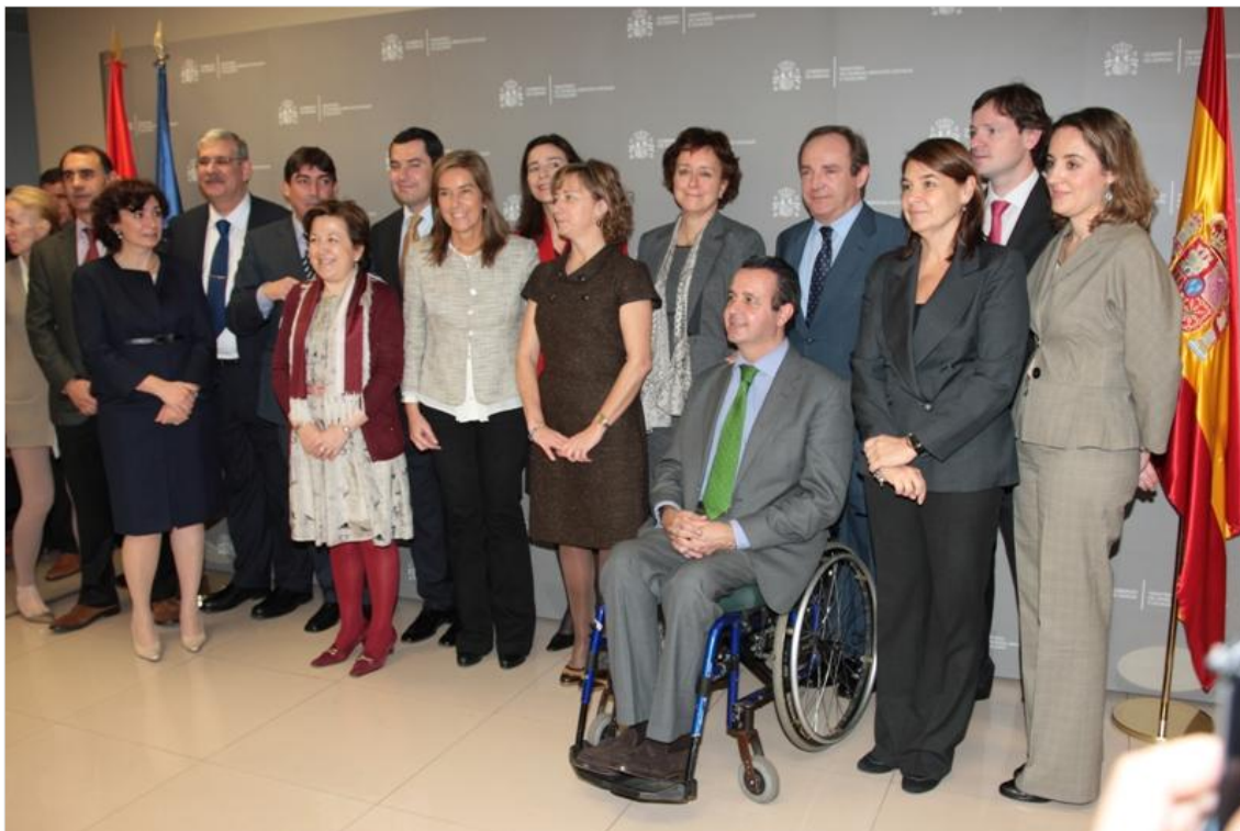
La Ministra de Sanidad, Servicios Sociales e Igualdad, Ana Mato, junto al nuevo equipo ministerial.

La ministra de Sanidad, Servicios Sociales e Igualdad expone en el Congreso de los Diputados su “hoja de ruta” para la legislatura. Ana Mato ha comparecido el 1 de febrero ante la Comisión de Sanidad y Servicios Sociales del Congreso de los Diputados para explicar las líneas básicas que seguirá al frente del departamento. Durante la misma, Mato ha anunciado que propondrá al Parlamento un gran Pacto de Estado Social y Sanitario, a la vez que se mostró partidaria de sentar las bases del acuerdo con las Comunidades Autónomas antes de elevarlo a la categoría de Anteproyecto de Ley.