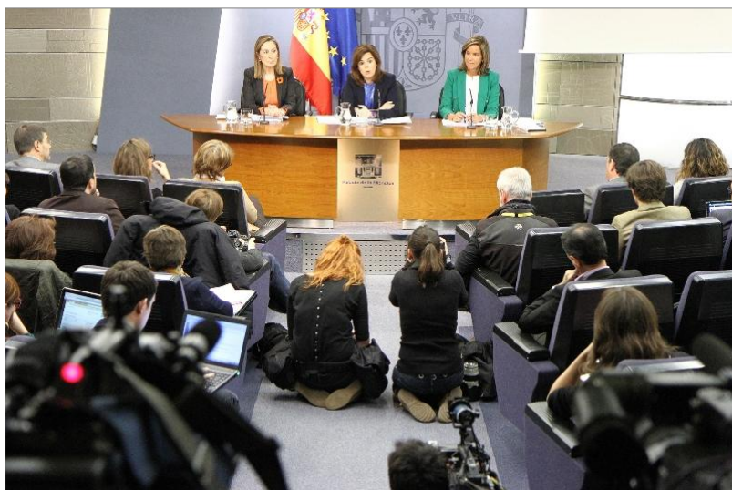
La vicepresidenta del Gobierno, ministra de la Presidencia y Portavoz, Soraya Sáenz de Santamaría, la ministra de Fomento, Ana Pastor, y la ministra de Sanidad, Servicios Sociales e Igualdad, Ana Mato, durante la rueda de prensa posterior al Consejo de Ministros.

Aprobado el Plan de Infancia y Adolescencia 2013-2016. A propuesta del Ministerio de Sanidad, Servicios Sociales e Igualdad, el Gobierno ha aprobado el pasado 5 de abril este plan que incluye entre sus medidas ampliar a los 18 años la edad de consumo del alcohol y la atención pediátrica, dentro de las acciones específicas para "promover una buena salud y hábitos saludables en la infancia y adolescencia".